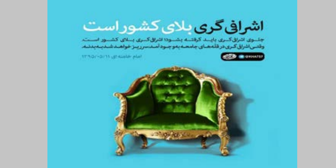
اشرافی‌گری، باید گرفته بشود! اشراف‌گری، بلای کشور است

مقام معظم رهبری:یکی از موانع مهم، عیوب اساسی در سبک زندگی ما است؛ این دیگر مربوط به مسئولین نیست، مربوط به خود ما و شما احاد مردم است. ما در سبک زندگی مشکلاتی داریم: یکی از مشکلات ما، مصرف‌گرایی است؛ یکی از مشکلات ما، اسراف و زیاده‌روی و زیاد خرج کردن است؛ یکی از مشکلات ما رفاه‌طلبی افراطی است؛ یکی از مشکلات ما اشرافیگری است. اشرافیگری متأسفانه از طبقات بالا سرریز میشود به طبقات پایین؛ آدم متوسط –[یعنی] از قشرهای متوسط– هم وقتی میخواهد میهمانی بگیرد، وقتی میخواهد عروسی بگیرد، مثل اشراف عروسی میگیرد. این عیب است، این خطا است، این ضربه‌ی به کشور میزند. زیاد مصرف کردن، زیاد خواستن، زیادی خوردن، زیادی خرج کردن، جزو عیوب مهمّ ما است در سبک زندگی‌مان. امروزه مسئله‌ای که رد و پای آن در ایجاد مشکلات اساسی کشور دیده می‌شود مسئله اشرافی‌گری است مثلاً وقتی تحقیق می‌کنیم که چرا ازدواج‌ها دیر هنگام شده است یا چرا سرمایه‌گذاران اموال خود را در پروژه‌های تولیدی داخلی سرمایه‌گذاری نمی‌کنند و ... می‌بینیم عنصری به اسم اشرافی‌گری مانع تحقق پیشرفت در بعد فردی و در بعد اجتماعی می‌شود. پس از این جهت که خیلی از مشکلات مستقیم یا غیر مستقیم نشأت گرفته از اشرافی‌گری است بررسی دقیق آن حائز اهمیت است. تبیین مسئله اشرافی‌گری اما قبل از اینکه از آسیب‌های فردی و اجتماعی اشرافی‌گری بگوییم لازم