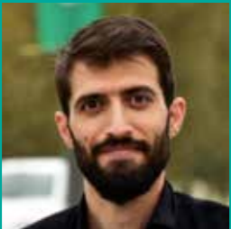
مرتضی قربانی طنزپرداز