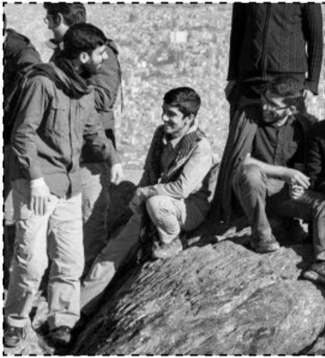
گروه کوهنوردی شهید علم الهدی