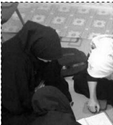
گروه جهاد حاشیه با محوریت تدریس