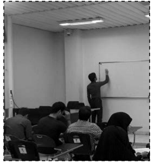
طرح زکات علم در ایام امتحانات