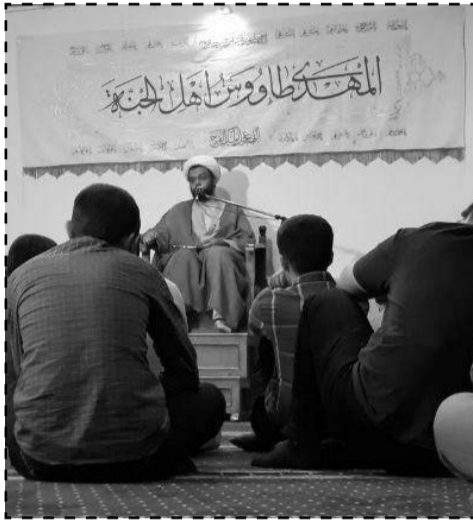
هیئت هفتگی ریحانه النبی