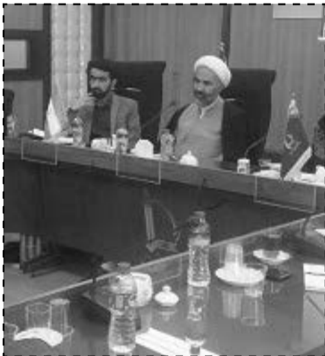
نشست نشریات دانشجویی کشوری