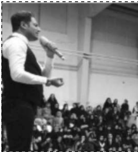
جشن انرژی جنبشی