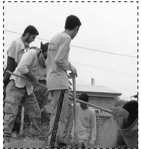
اردوی جهادی شهرستان آق قلا