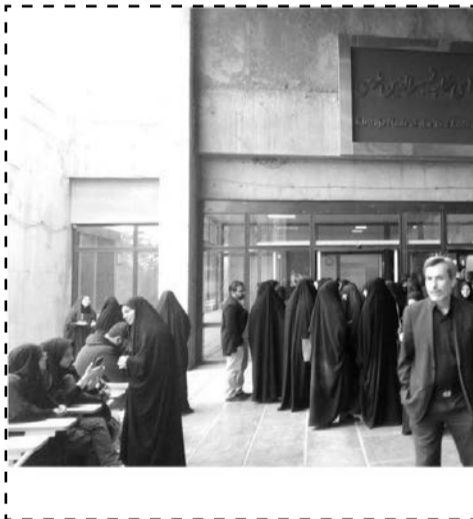
اکران فیلم سینمایی ۲۳ نفر