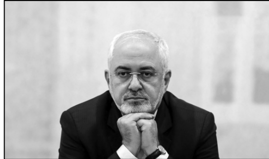
۱ نتیجه ی رفت و برگشت!