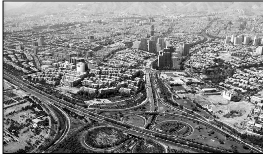
۲ تمرکز ۸۱ درصدی پول کشور در یک استان

دوهفته نامه سیاسی بسیج دانشجویی دانشگاه فردوسی مشهد، سال اول، شماره چهارم، شماره مجوز: ۹۷۸۴۶، نیمه دوم اسفند ماه ۱۳۹۷