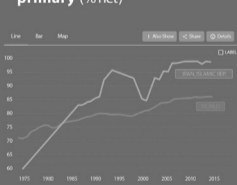
School enrollment primary (% net)

ثبت نام مقطع ابتدایی در کشور ایران در سال ۲۰۱۵ تقریباً ۱۰۰ درصد کودکانی که در سن ورود به مدرسه بودند در مقطع ابتدایی ثبت نام کرده اند. در حالی که این رقم در سال ۱۳۷۱ تنها حدود ۶۰ درصد بوده است.