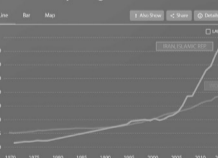
School enrollment tertiary (% gross)

ثبت نام دانشگاه در کشور ایران نرخ ثبت نام در دانشگاه در سال ۲۰۱۶ تقریباً ۶۹ درصد بود در حالی که این رقم در سال ۱۳۷۸ معنای حدود ۵ درصد داشته است.