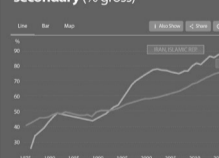
School enrollment secondary (% gross)

ثبت نام مقطع متوسطه در کشور ایران نرخ ثبت نام مقطع متوسطه در سال ۲۰۱۵ تقریباً ۸۹ درصد بود در حالی که این رقم در سال ۱۳۷۲ معنای حدود ۴ درصد داشته است.