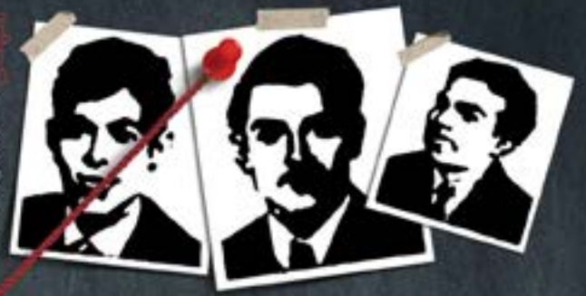
سه تن از دانشجوی سال ۱۳۳۲

فصلنامه شهریه، سال سوم، شماره پنجم، پاییز ۱۴۰۱، شماره مجوز ۹۹۱۰۰۲۲