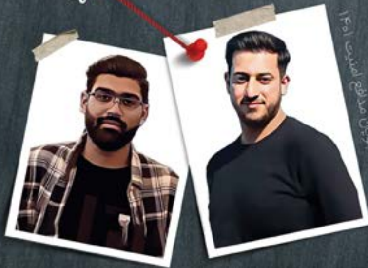
دانشجویان صدراعظمی ۱۴۰۱