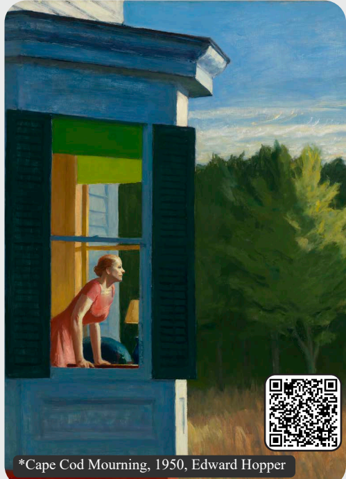
*Cape Cod Mourning, 1950, Edward Hopper